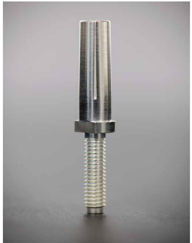
Robustes Kontaktsystem ODU TURNTAC®

Das ist erst der Anfang. Die neuen IT-Lösungen – sie werden gegenwärtig von den Endanwendern am Hauptstandort in Mühlendorf genutzt – werden demnächst in Form eines templategestützten Rollouts in den Produktionswerken in China und in Rumänien eingeführt.