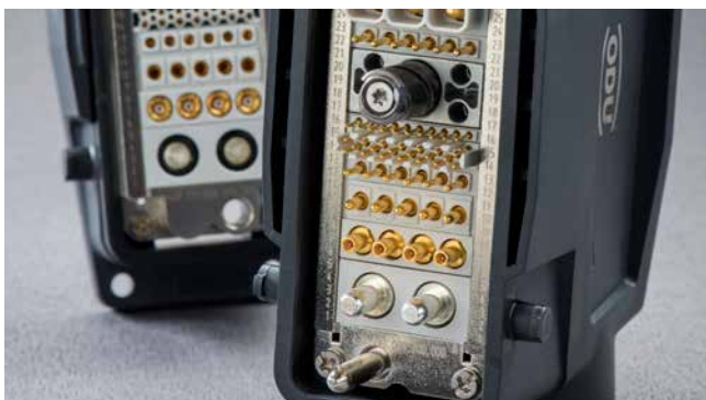
Modularer Steckverbinder – ODU-MAC® Blue-Line